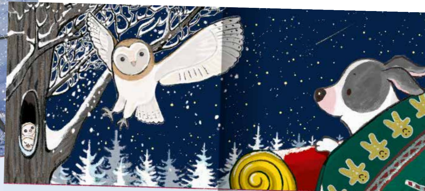
C'était la chouette. « Dis-moi, où t'envoles-tu ainsi ? » lui demanda le petit chiot.