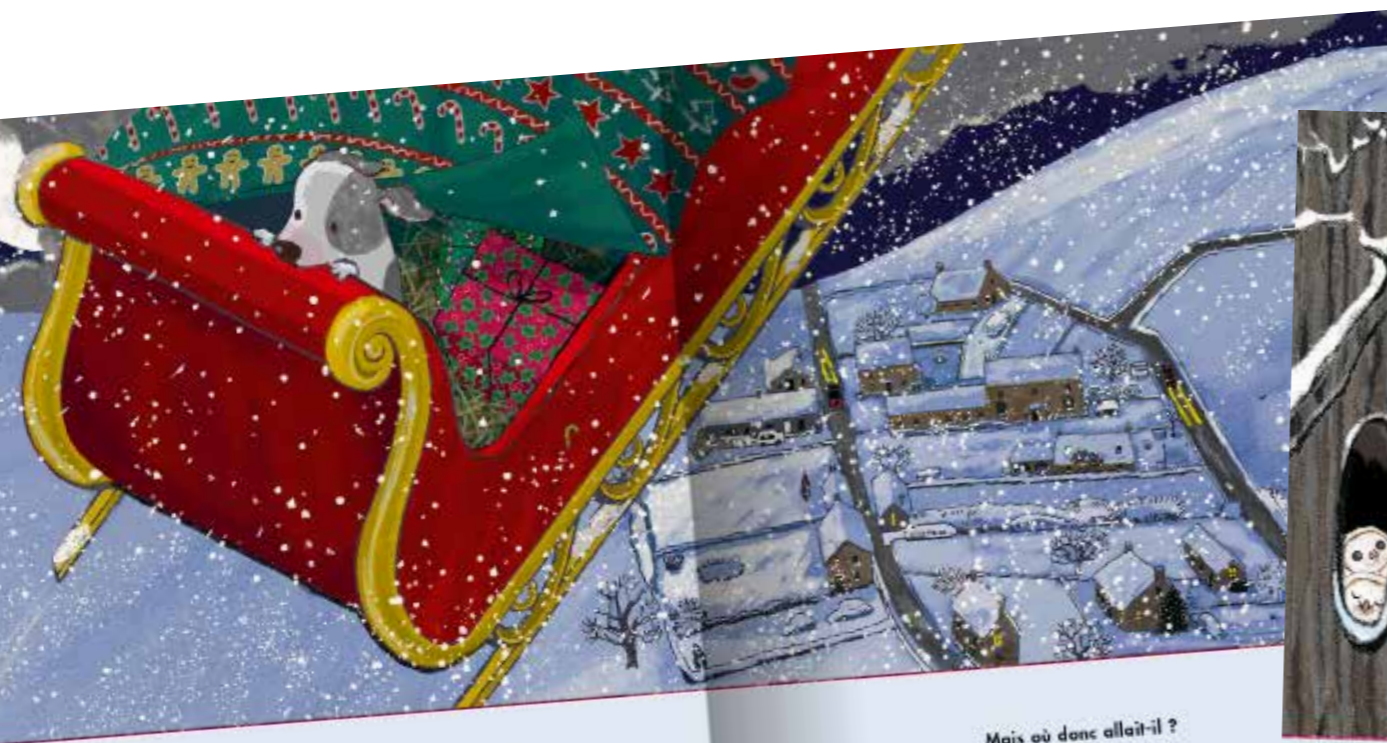
Woooooup ! Il volait dans les airs ! En dessous, le monde lui paraissait minuscule... plus du tout effrayant !

Par une soirée d'hiver glaciale, un petit chiot seul et perdu cherche un abri dans un monde trop grand pour lui. Transi de froid, il se cache pour la nuit... sans savoir qu'il s'apprête à vivre un voyage extraordinaire.