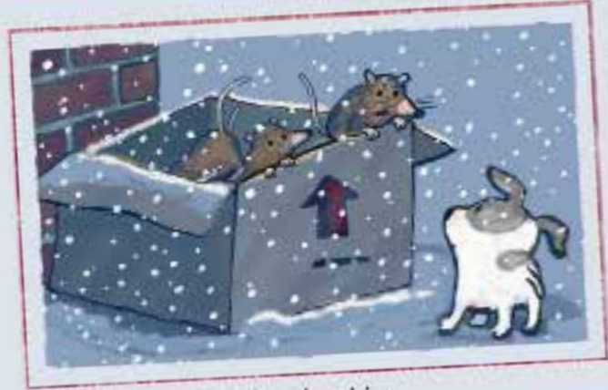
Il explora ici...