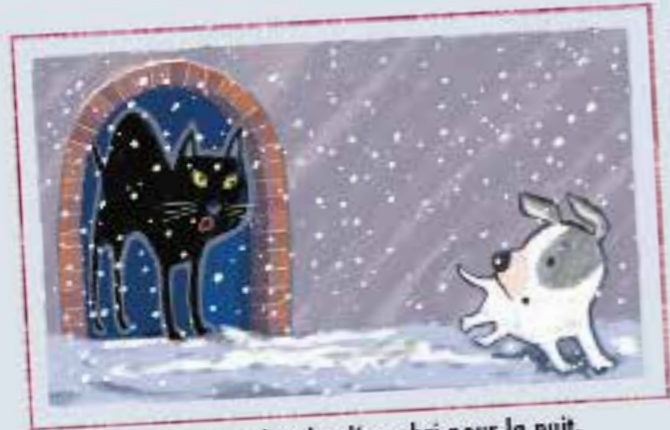
et là, à la recherche d'un abri pour la nuit.