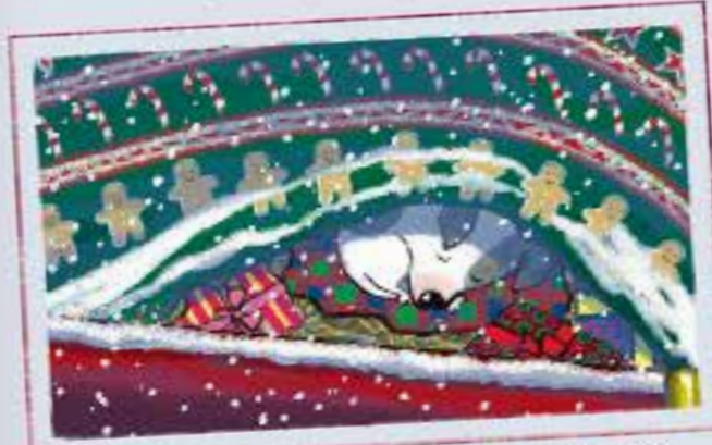
Enfin, il trouva un petit coin idéal pour se blottir.

Par une soirée d'hiver glaciale, un petit chiot seul et perdu cherche un abri dans un monde trop grand pour lui. Transi de froid, il se cache pour la nuit... sans savoir qu'il s'apprête à vivre un voyage extraordinaire.