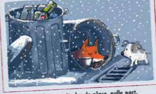
Mais il n'y avait plus de place, nulle part.