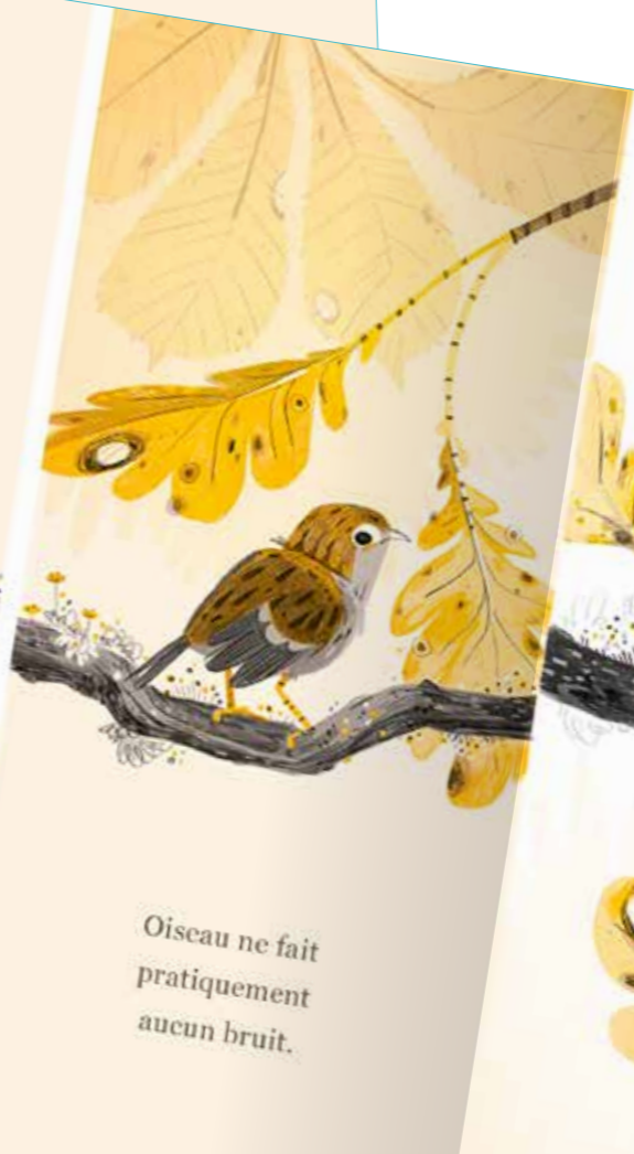
Oiseau ne fait presque aucun bruit.