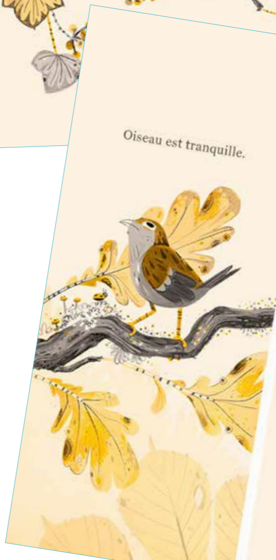
Oiseau est tranquille.