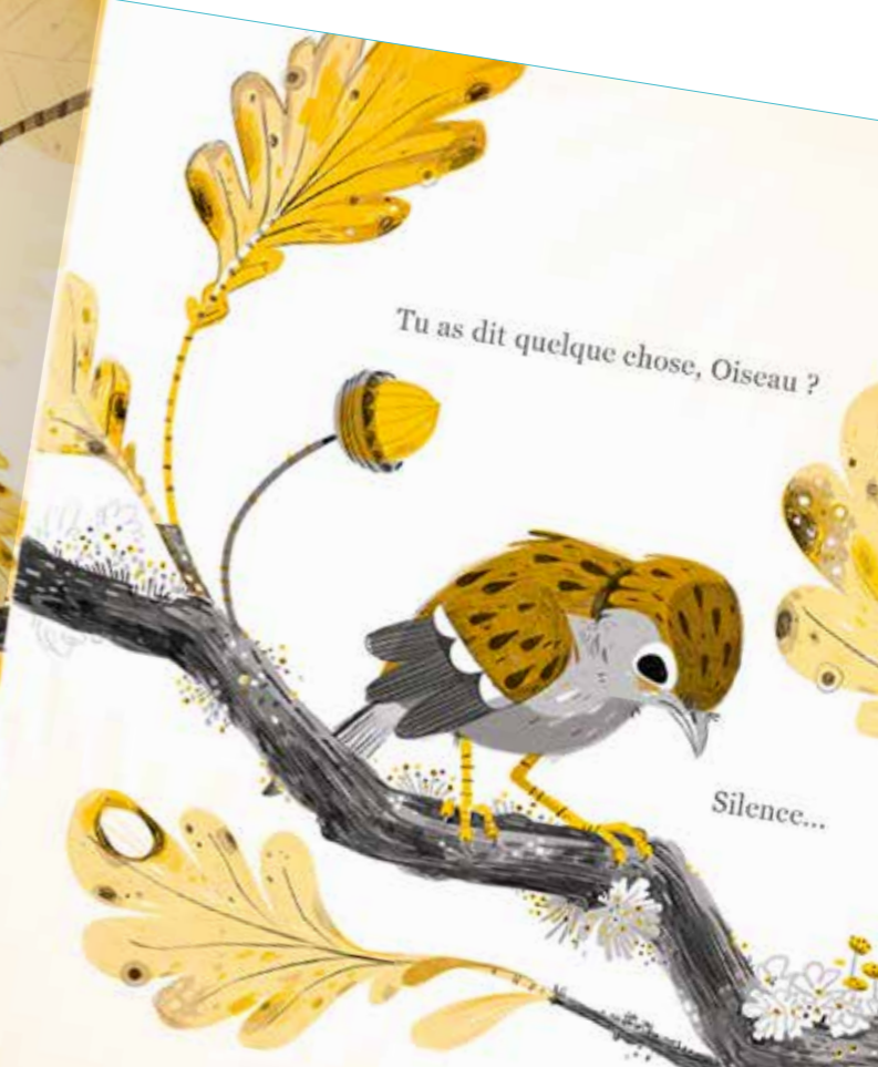
Tu as dit quelque chose, Oiseau ?